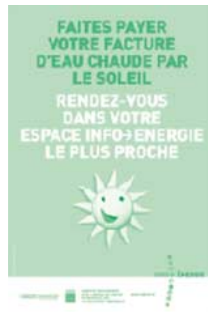
la lettre d'AGIR POUR L'ENVIRONNEMENT • hiver 2002 • N° 7

Pour connaître le PIE le plus proche de chez vous, n'hésitez pas à appeler le numéro azur 0810 060 050 ou à consulter le site Internet de l'Ademe : ( http://www.ademe.fr/particuliers/pie/liste@eie.asp ). Un conseiller pourra répondre à vos questions.